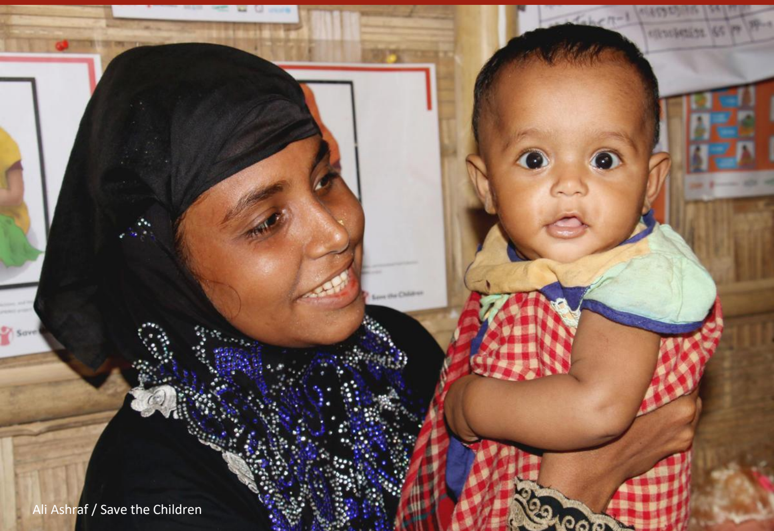
Ali Ashraf / Save the Children